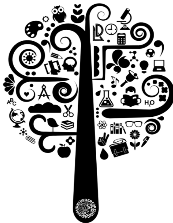
PROFESSIONSIDEAL FOR DANMARKS LÆRERFORENING

Med afsæt i vores idealer og vores strategi vil foreningen fortsat stille krav om en markant styrkelse af folkeskolens økonomi og tydeliggøre betydningen af et godt arbejdsmiljø og aftalte rammer i arbejdet, der sikrer en bedre balance mellem krav og resurser. Samtidig vil vi have fokus på at tydeliggøre betydningen og ansvaret blandt beslutningstagere og folkeskolens interessenter for, at de også har et ansvar for i deres beslutninger og handlinger at understøtte en stærk lærerprofession, der kan udvikle folkeskolen og i deres daglige virke opfylde folkeskolens formål og undervisningsmål.